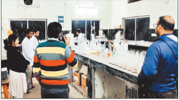
पटेलपाली स्थित मिट्टी जांच लेब की जांच में पहुंचे कृषि विभाग के अधिकारी।