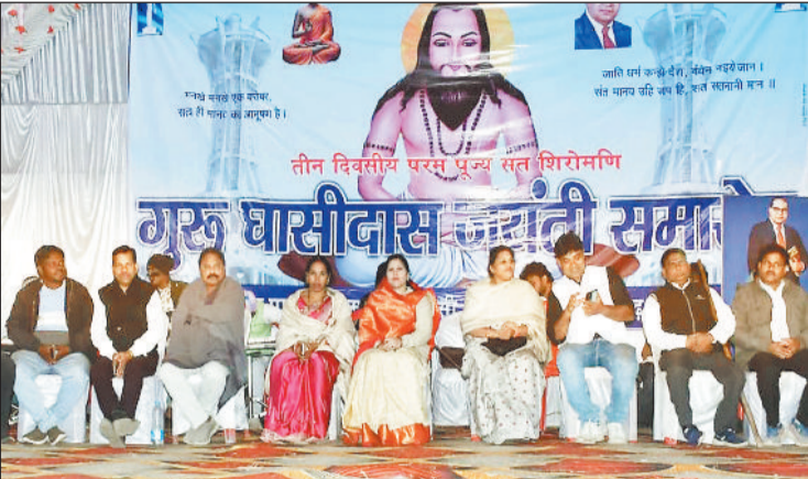
कार्यक्रम में उपस्थित सारंगढ़ विधायक और अन्य अतिथि।